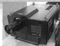
世界最高峰の8Kプロジェクター