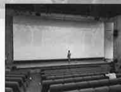
劇場内のスクリーン