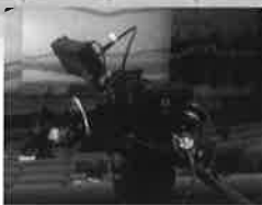
高精細8Kカムコーダ